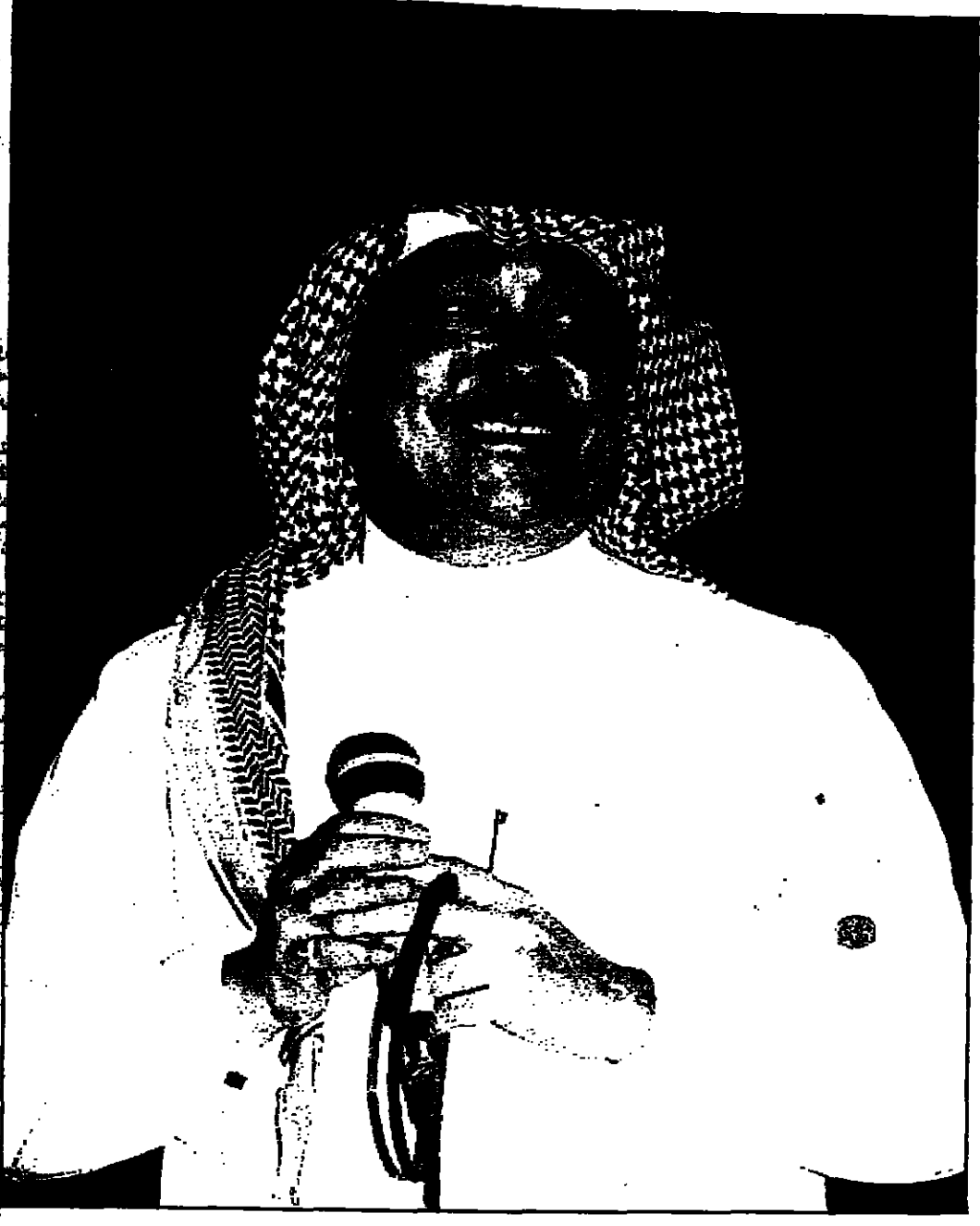
علي عبد الكريم (القدس العربي)

الوجدان وتخطب الاحاسيس - والاحسان المستنارة من يتابع تراثنا العربي الاصيل.